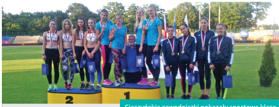
Cieszyńskie zawodniczki pokazały sportową klasę

Święto cieszyńskiej lekkiej atletyki miało miejsce 8-9 lipca na stadionie im. Grzegorza Duneckiego w Toruniu podczas Mistrzostw Polski U-20 (juniorów z roczników 1998 i 1999). Zawodniczki MUKS SZS Cieszyn zdobyły dwa brązowe medale w konkurencjach sztafet 4x100 m i 4x400 m.