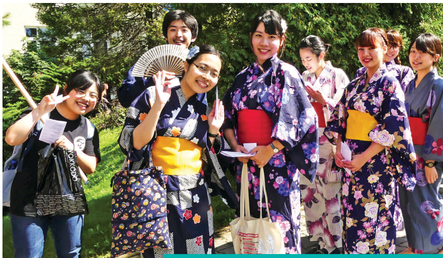
Uczestnicy letniej szkoły w drodze na Wieczer Narodów

Mówimy, że podczas letniej szkoły studenci uczą się języka polskiego 24 h na dobę – podczas nauki, posiłków, zabawy... Do południa odbywają się zajęcia typowo lekcyjne z nauką słownictwa gramatyki, itp. Co warto podkreślić, osoby, które przyjeżdżają, są na różnym poziomie znajomości języka polskiego – od bieglej