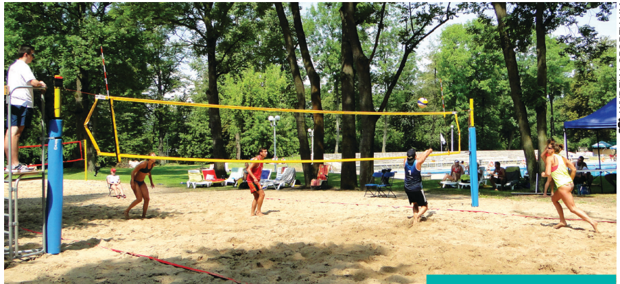
Prawie jak nad morzem...

Zwycięzcom oraz wszystkim zawodnikom gratulujemy! Dziękujemy sędziom na