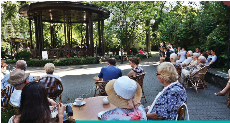
Koncerty w Parku Pokoju przyciągają nie tylko melomanów

9 lipca Lato z Muzyką zawitało po raz kolejny do Parku Pokoju w Cieszynie. Cykl niedzielnych koncertów rozpoczął występ zespołu Symetrio, który zdobył serca słuchaczy w wielu miejscach Europy i z całą pewnością również w naszym mieście.